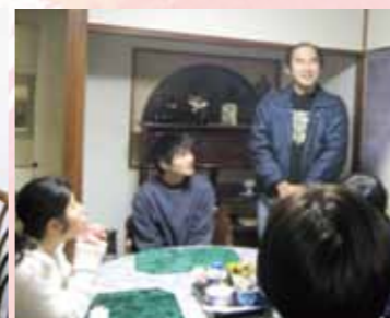
僕はフレンドで就職を目指しています。