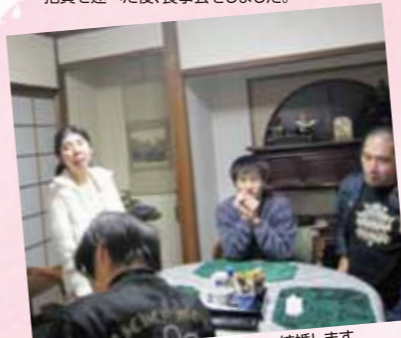
私は、仕事を頑張って就職したいし、結婚します。