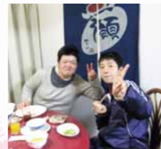
どんぐり会(ホーム自治会)抱負を述べた後、食事をしました。

安定的運営のために今後検討課題も多いですが、これからも利用者の方へのサービス向上を目指して頑張りますので、よろしくお願い申し上げます。