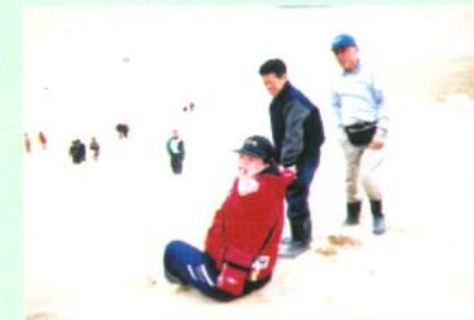
オ～イ広いね～ (鳥取砂丘)