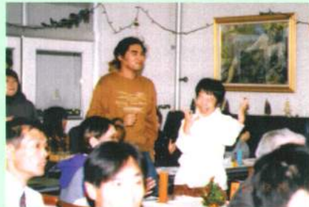
お母さん元気ですか。 私楽しくしてましてよ！