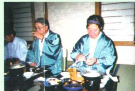
旅行の楽しみのひとつにこの 食事がありますよね。ビールですか？