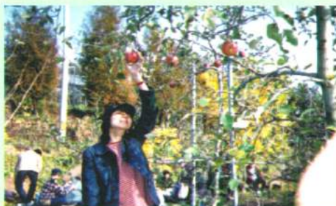
いいお天気にめぐまれリンゴ狩り