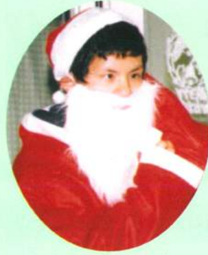
サンタクロースはだれ？