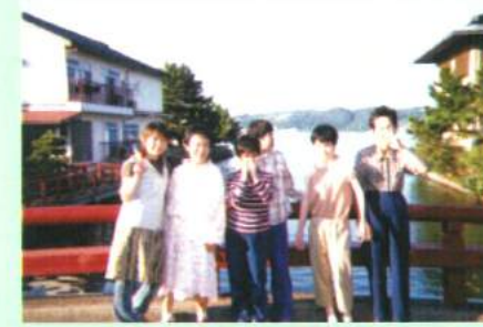
ハワイ温泉にひたりました