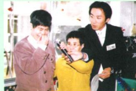
瀬戸の花嫁をうたいます