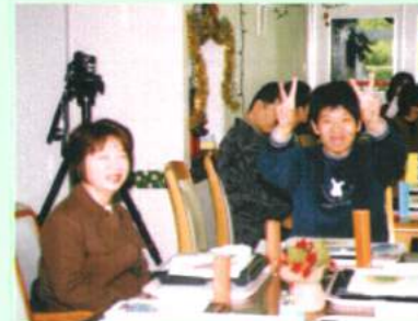
お父さん、お母さんが来てくれる のか、その日まで心配しました。 イエーイ！