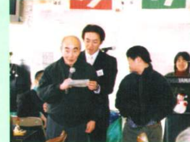
自治会々長よりあいさつ みなさん、楽しくやって下さい