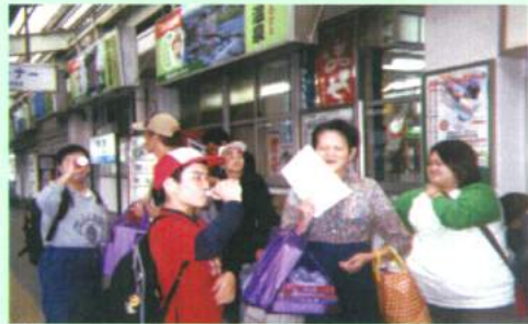
JRをつかって(一泊組)