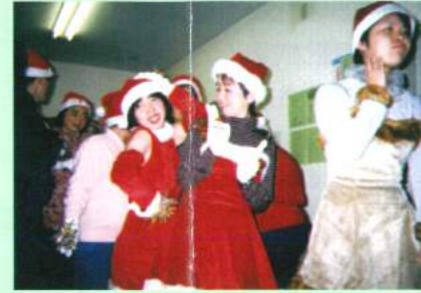
ハア～い！楽しんでま～す