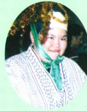
私、マツケン様です