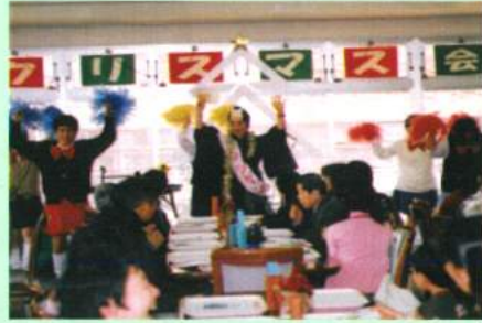
今年はヨン様と マツケンサンパで盛り上がり

運動会、夏祭り、旅行、クリスマス会、新年会、新成人を祝う会、還暦を祝う会など単調な生活にならないように行事をするわけですが、行事について自治会での話し合いを大切にしてきました。旅行も行き先、日程など希望によっていくつかの班に別れて行われました。クリスマス会も持田寮とういんぐを別々にしました。行事はわかりやすく意見が出しやすい議案だと思っています。そうした手間隙をかけた運営が一人ひとりの声を育てるものと信じて積み上げていますし、実際に一人ひとりとの会話が増えたように感じています。