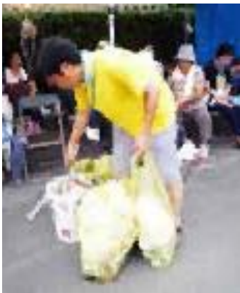
ゴミ拾い・ゴミ袋交換