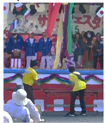
ステージ裏方作業