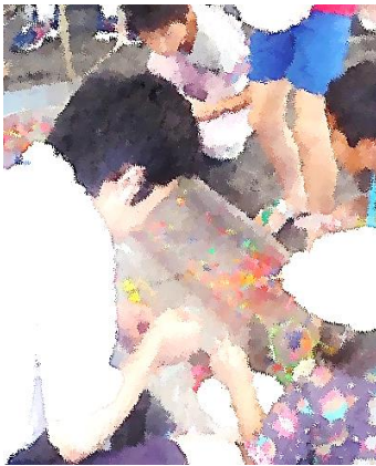
スーパーボールすくい