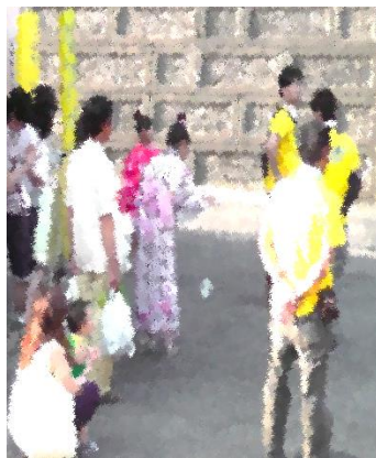
駐車場・駐輪場整備